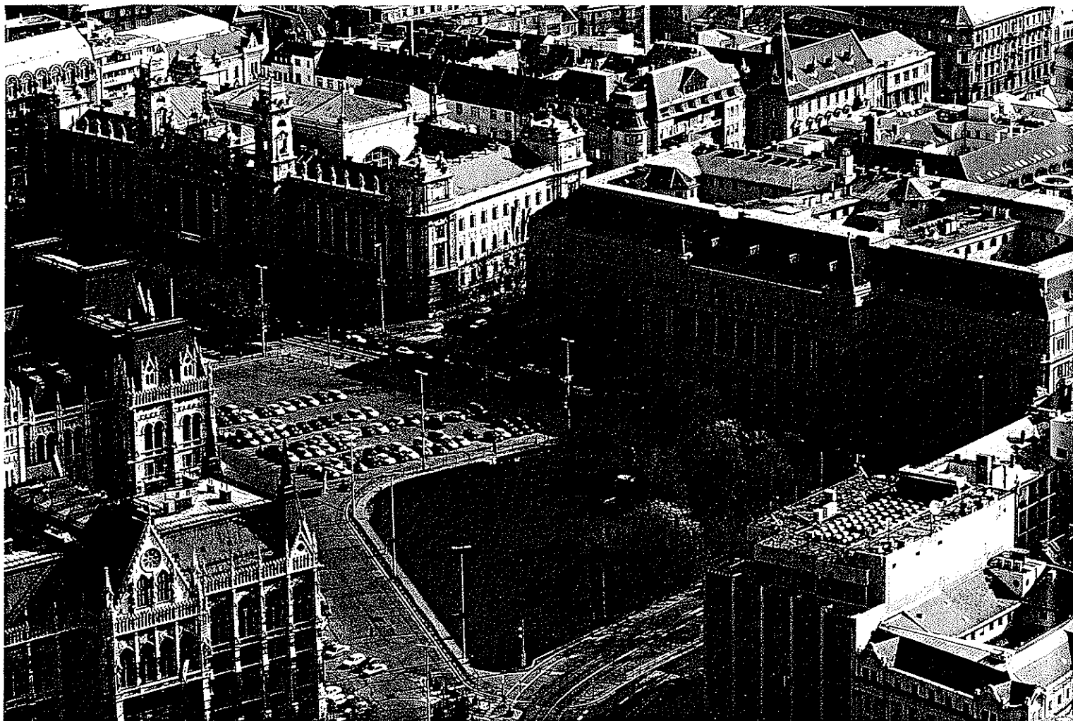
Itt formálódik a Kossuth téri „alkotmányos háromszög”